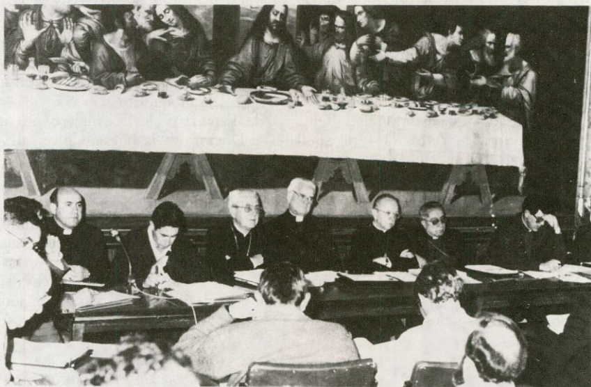
El Sr. arzobispo de Valladolid, junto con los demás Sres. Obispos de la Región de Castilla presidieron los actos de las Jornadas de Estudio sobre la Juventud, en Villagarcía de Campos (Valladolid)

Durante cuatro días, del 13 al 16, los Obispos de la Región del Duero, los Vicarios Pastorales de las nueve diócesis, los Delegados de la Juventud y los Arciprestes se han reunido en Villagarcía de Campos (Valladolid) para estudiar el campo de la juventud.