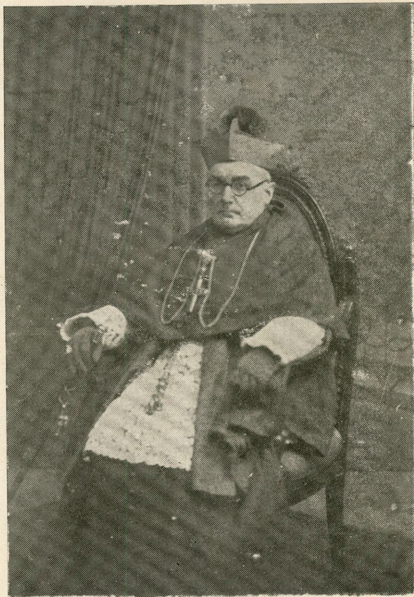
Excmo. y Rvmo. Sr. Dr D. Enrique Plá y Deniel Nuevo Obispo de Salamanca.