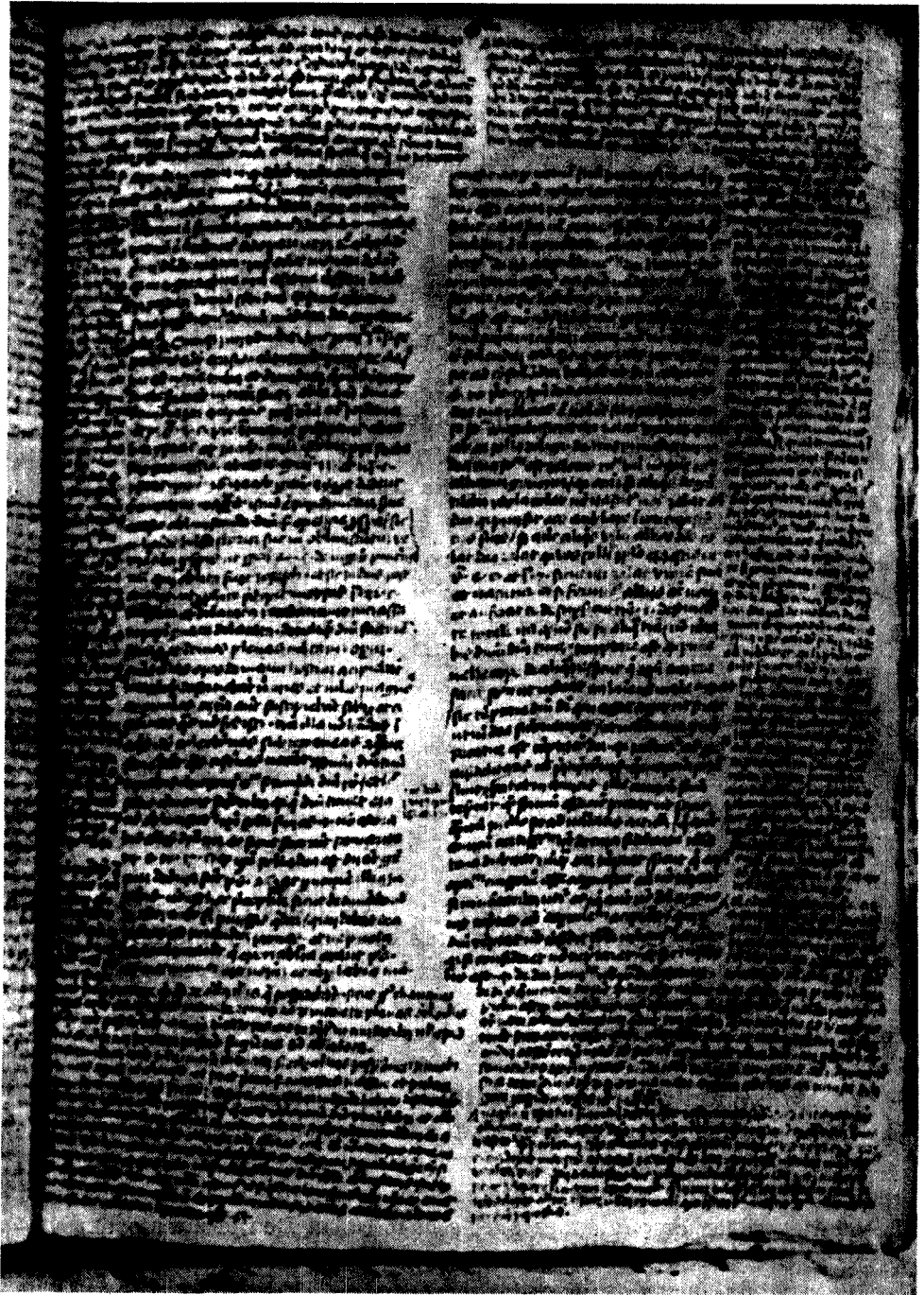
Ms. 2504: DEUTERONOMIO. fol. 28r (Autógrafo del Tostado)