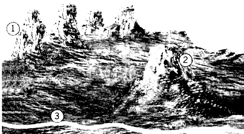
(Belmonte de Llanes)