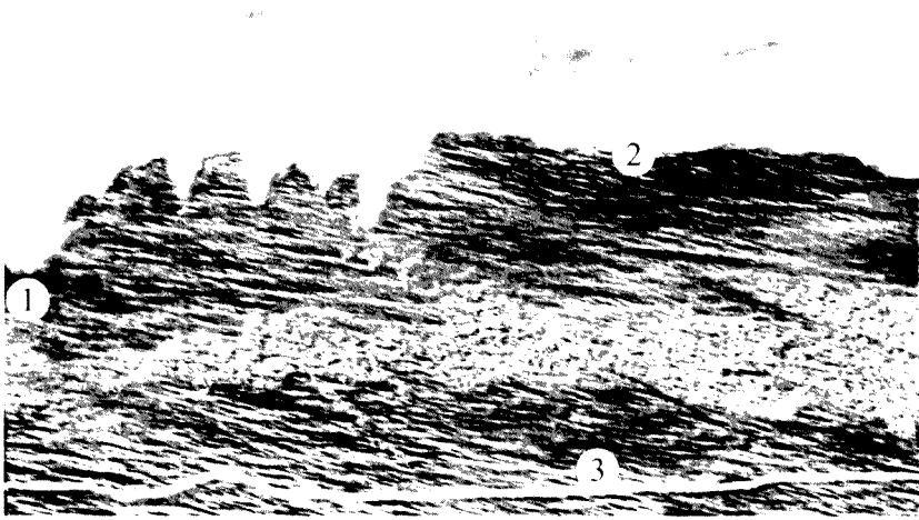
(Belmonte de Castropol)

Bajo el aspecto antropológico-religioso el macizo calcáreo del Monte dos Bois era para los creyentes celtas otra hierofanía, que ponía de manifiesto, a través de la albura de la piedra de caliza, la presencia física de los «bueyes» del dios Bel.