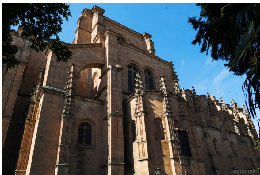
Fig. 1. Exterior de la capilla de las Reliquias de la iglesia de San Esteban de Salamanca.