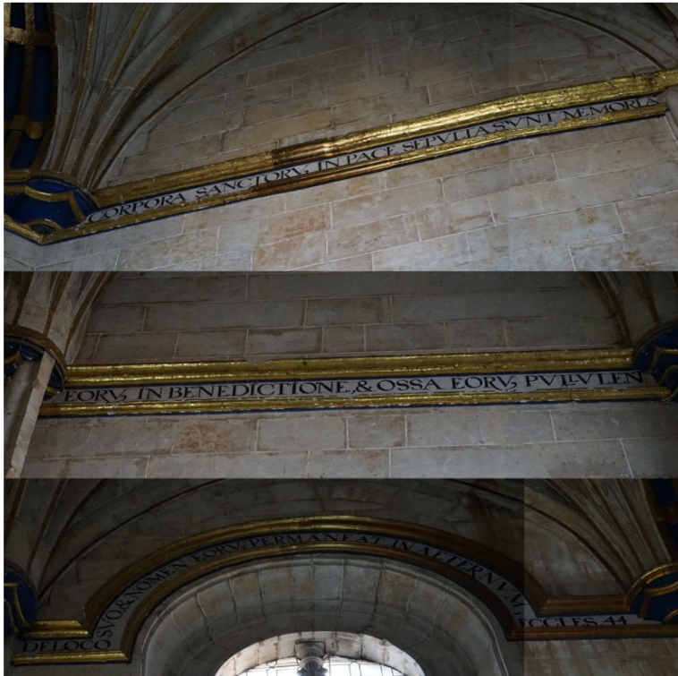
Fig. 4. Detalle de la inscripción de la imposta en la capilla de las Reliquias de San Esteban de Salamanca.

Las imágenes se completan con una inscripción bíblica que recorre el perímetro (Fig. 4), con el texto original adaptado a la función de la capilla como relicario: corpora sanctoru[m], in pace sepulta svnt memoria eoru[m], in benedictione, & ossa eoru[m], pvlivent de loco svo & nomen eoru[m] permaneat in aeternvm, eccles 44. (Los cuerpos de los santos fueron sepultados en paz. Ben-