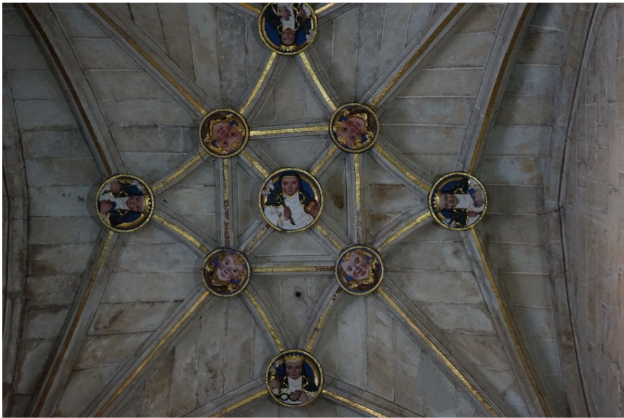
Fig. 3. Detalle de las claves de bóveda de la capilla de las Reliquias en San Esteban de Salamanca.

de la orden, creando nuevos vínculos entre las beatas y los frailes, llegándose a permitir a las terciarias vestir el hábito dominico y reconociendo y valorando su función como predicadoras ejemplares 51 . Esta imagen idealizada de predicadora asociada a santa Catalina se construyó intencionadamente como modelo de santidad y predicación 52 , basado en la narración ordenada y concebida por fray Raimundo de Capua y fray Tomás Caffarini en la que encauzaron la vida e intervenciones orales de la santa hasta llegar a definir las como sermones. De esta forma, entre los siglos XIII y XIV se consiguió equiparar su figura con la de santo Domingo, fundamentada en los paralelismos de sus palabras y hechos, como concluyen Kienzle y Stevens de la elaboración de su hagiografía en la península itálica 53 .