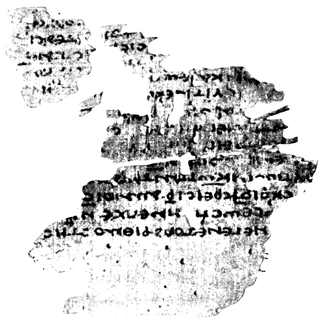
P. Barc. 3. Verso, 2 Par, 29, 32 - 35