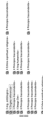
GRÁFICO 2. Intertextualidad en el dogma de referencia

of consciousness and personal responsibility for each of us, if it is to be resolved more quickly. In His perfect wisdom, God has laid down the aims and laws that pertain to the operation of the entire divine Creation, and has provided for the self-sufficient protection of its life. Therefore, He designated the human person as a steward, and not as a destroyer of the divine Creation. He did this because humanity is the finest member, the microcosm, the king of the entire divine Creation. Consequently, if humanity's stewardship is unfaithful to the divine commandment, that it should work and maintain the creation within which it was placed, then humanity is unfaithful to itself, destroying God's house which sustains its own life.