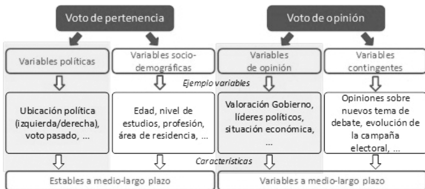
Figura 2. Tipos de voto y variables relacionadas con la decisión de voto.

En los meses anteriores a las elecciones, las variables contingentes son las que más influyen sobre la declaración de voto de los entrevistados en las encuestas: una nue-