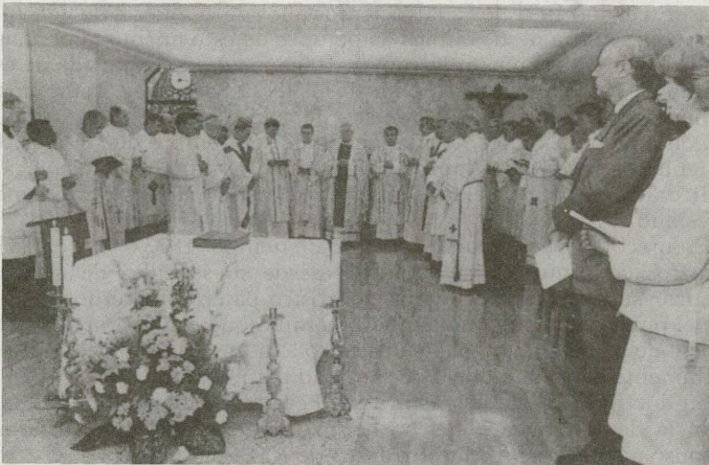
El Cardenal Arzobispo de Glasgow, el Nuncio de S.S. Mons. Lajos Kada, D. Braulio, Obispo de Salamanca, demás obispos escoceses y sacerdotes de Escocia y Salamanca en la solemne concelebración. Sres. Embajadores del Reino Unido en España.

El Real Colegio de los Escoceses tiene previsto organizar diferentes actividades con motivo de la inauguración de las nuevas dependencias.